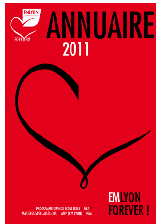
Annuaire des Diplômés